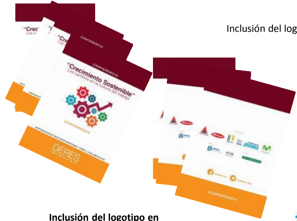
Inclusión del logotipo