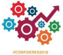
Inclusión del logotipo en materiales entregados a los asistentes (agenda, encuestas, etc).