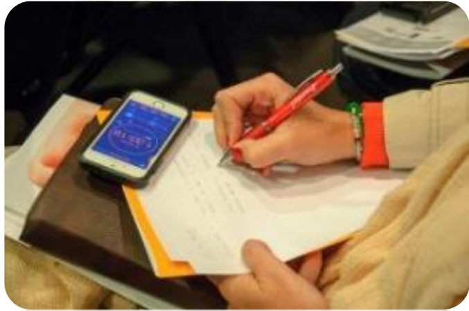
Inclusión de folletería de la empresa en la carpeta del evento